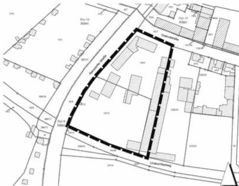
Darstellung ohne Maßstab