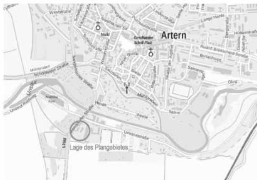
Darstellung ohne Maßstab