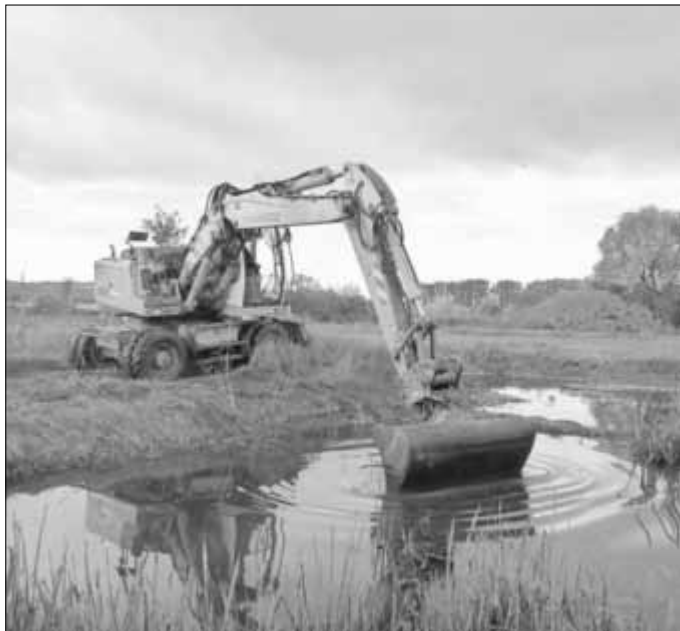
Entschlammung der Laichtasche II im Oktober 2019 durch die Landschaftsbaufirma

Der Abschluss des Projekts ist für den Oktober 2021 geplant. Eine langfristige, artenschutzfreundliche Bewirtschaftung der Gewässer wird auch danach sichergestellt. Hierfür soll der Gewässerunterhaltungsplan der Kleinen Helme an den Artenschutz angepasst werden.