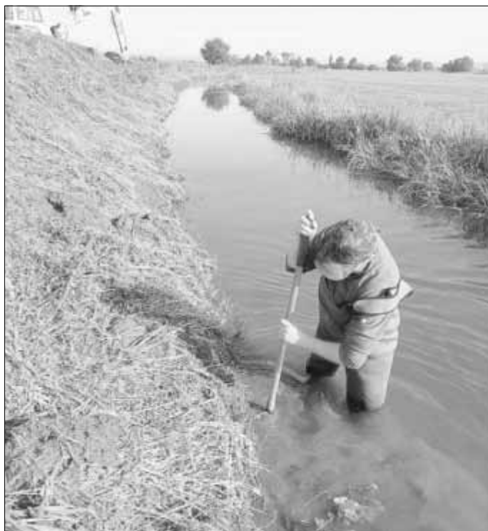
Mitarbeiter der Landschaftsbaufirma Gebhardt bei der Bepflanzung der neuangelegten Längsberme an der Kleinen Helme im Oktober 2020

Um weitere Lebensräume in den Nebengräben zu ermöglichen, sind für den Graben 38 und den Graben nordöstlich Voigtstedt Räumungs- und Pflegemaßnahmen geplant. Der Graben 38 wurde bereits 2019 geräumt und die Uferböschung gemäht, sodass er wieder ausreichend Wasser führt und besonnte Stellen als Libellenhabitat vorhanden sind. Für den Graben nordöstlich Voigtstedt erfolgte im September 2020 bereits eine teilweise Räumung und ein Rückschnitt von Sträuchern und Bäumen. Hier sind noch die restliche Räumung sowie der Anschluss an die Kleine Helme über eine Rohrleitung geplant, um den Graben wieder ganzjährig mit Wasser zu versorgen und so den Libellen und ihren Larven einen Lebensraum zu bieten.